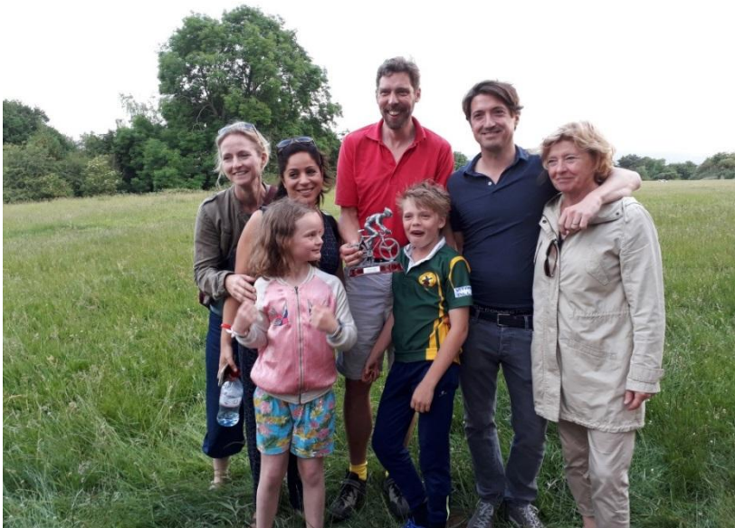
Aat Smits

Op vrijdagochtend begonnen we al vroeg aan een fietstocht naar en door verschillende dorpen in de buurt van Oxford. Na de fietstocht was er een afspraak voor een rondleiding in Christ Church in Oxford, het grootste College van Engeland. Hierna zijn we naar de roeibootloodsen gegaan waar we drie boten toegewezen kregen om te gaan "Punting": je boot voortbewegen met een aluminium stok.