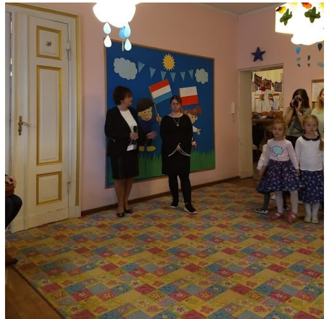
Directrice en een van haar pedagogisch medewerkers die tolk was