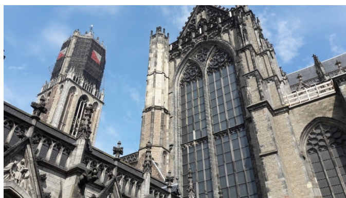
Excursie naar Utrecht.