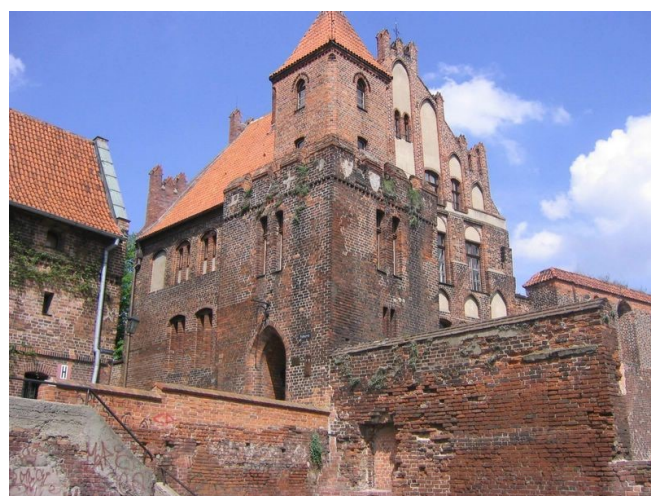
Het Podmurna gebouw in Toruń: