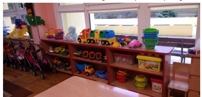
Veel gekleurd plastic speelgoed

Ons eerste bezoek, was aan Żłobek Miejski nr 3, de gemeente crèche voor kinderen van 0-3 jaar oud. Een lieve directrice, die ons ontving met veel lekkers en zeer transparant en vol passie vertelde over de kinderopvang in Polen. Wij kregen de ruimte om de verschillende groepen te bezoeken en met de medewerkers te praten. Grote open ruimtes, veel gekleurd plastic speelgoed, leuke thema activiteiten en een verpleegkundige, technisch onderhoudsmonteur, pedagoog en kok in dienst. Tijdens de rondleiding mochten we vragen stellen aan een van de pedagogisch medewerkers, die trots over haar collega's en kinderen vertelde. Wat mij het meest is bijgebleven, zijn de hoeveelheid kinderen in 1 groep, maar wel volgens dezelfde leidster-kind ratio, als in Nederland en dat alle kinderen voor het eerste jaar zindelijk zijn.