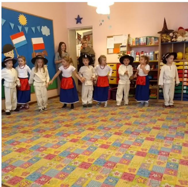
Optreden, over het leven in de bergen

Het tweede bezoek was aan Przedszkole „Świat Bajek”, een private kinderopvang, waar kinderen van 3-6 jaar worden begeleid, ter voorbereiding op school. Het gebouw en de groepen zien en voelen “schools”. We worden ontvangen door een Directrice en twee kinderen die ons toezingen als welkom. Het gebouw is op bepaalde plekken in het thema: Holland versierd en de kinderen hebben voor ons dans en zang optredens voorbereid, waarin ze het Poolse cultuurgood aan ons tonen. De kinderen vonden het prachtig dat wij zelf ook aan een aantal dansjes en liedjes mochten meedoen. Naast de optredens, was de directrice veel aan het woord en was er helaas weinig ruimte voor uitwisseling. Wat mij aan dit bezoek het meeste is bijgebleven, is hoe kinderen met bijvoorbeeld autisme te allen tijde voorrang hebben op de plaatsing binnen de kindergarten en deze kinderen 1 op 1 begeleiding krijgen binnen de reguliere groep kinderen. Er is veel ruimte voor creativiteit, zang, dans en ouderparticipatie. Ook hier zijn dagelijks orthopedagogen, verpleegkundigen en andere specialisten aanwezig.