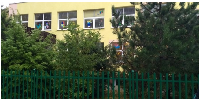
Żłobek Miejski nr 3 buitenzijde gebouw