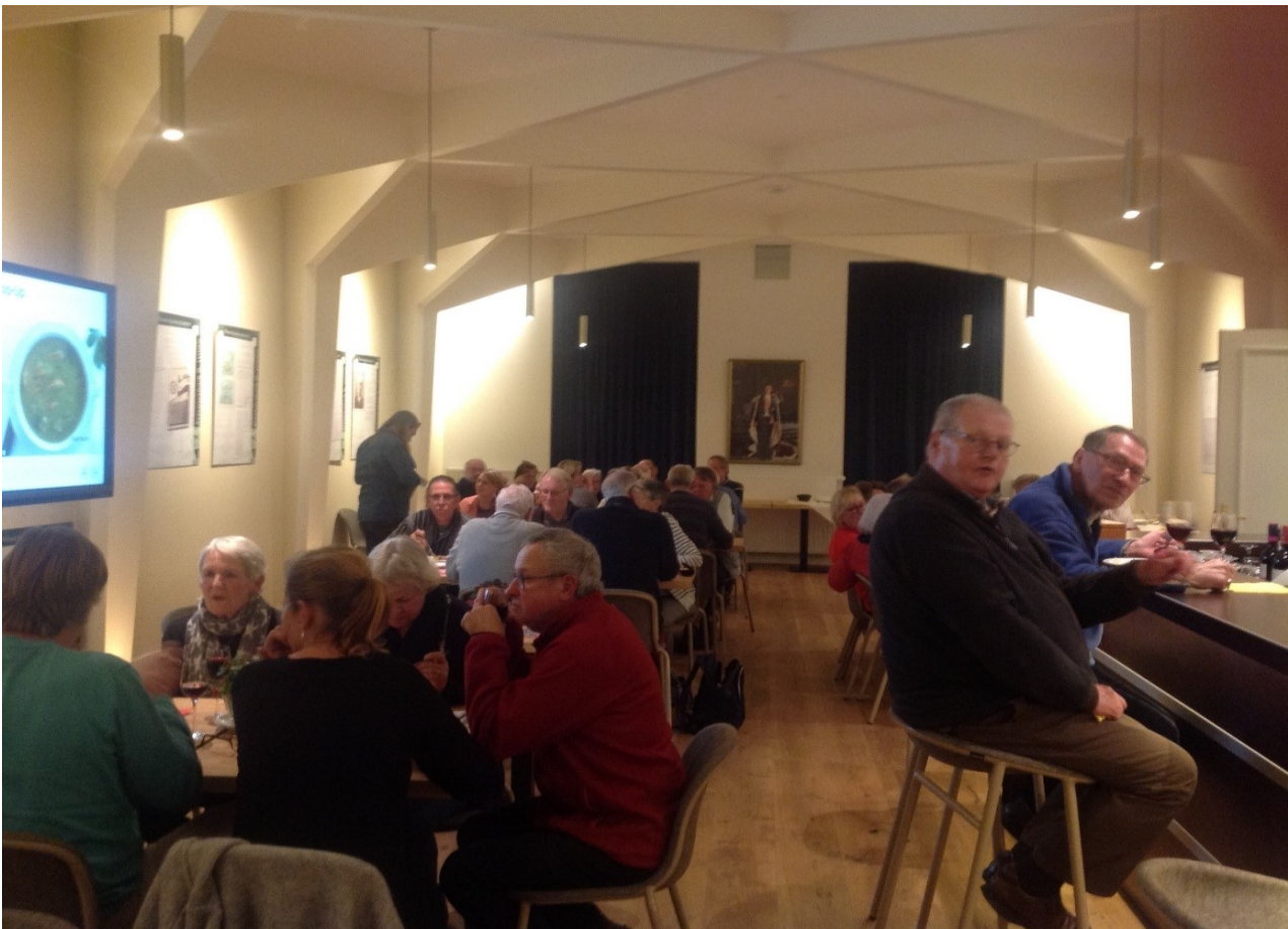
Deelnemers Toruń Terugkomavond, Logegebouw Steenschuur 6