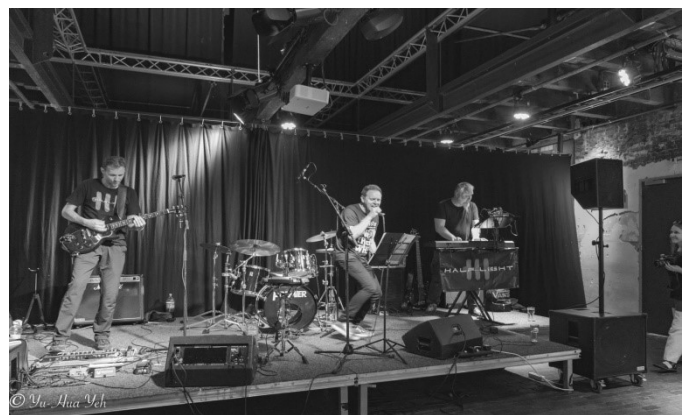
Optreden van Half Light