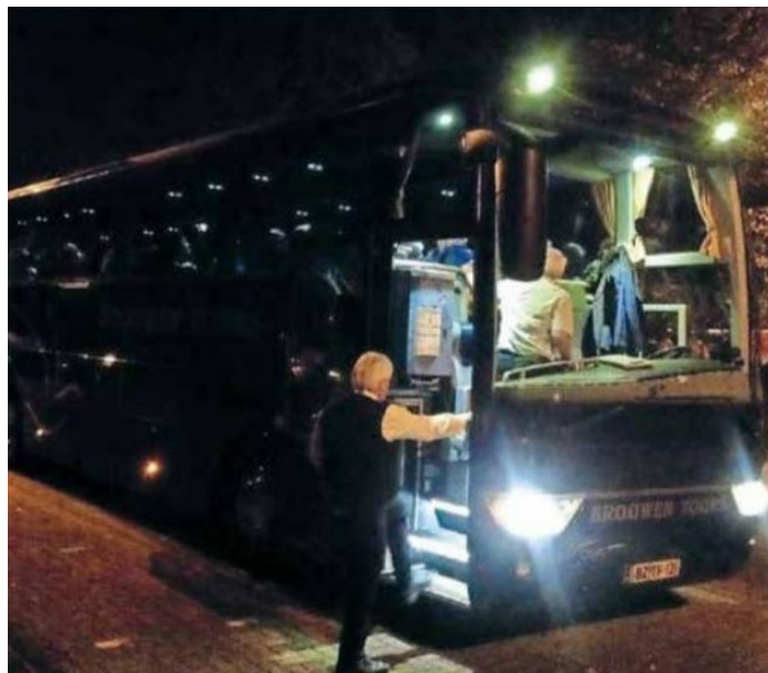
De Leidse bus staat gereed voor vertrek naar zusterstad Toruń

De stedenband tussen Leiden en de Poolse stad Toruń, opgericht in 1989, is nog springlevend. Vorig jaar werd het dertigjarig jubileum uitbundig gevierd. Afgelopen dinsdag 22 oktober vertrok voor de twintigste maal in de avond een bus met 45 leden van de Stichting Stedenband Leiden-Toruń naar de Poolse zuster gemeente, bij de Sint Petruskerk aan de Lammenschansweg. Deze groep zal in Toruń tot 26 oktober als vanouds verschillende sociaal-culturele activiteiten bijwonen, organiseren (waaronder een muziekconcours) en allang bestaande contacten aanhalen.