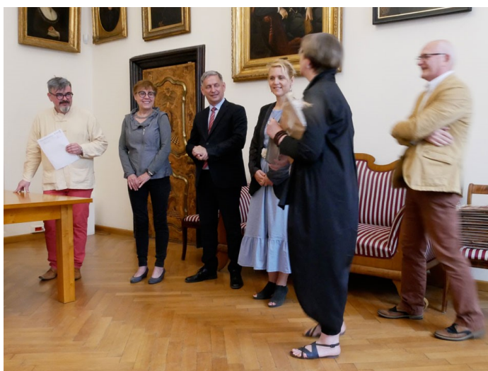
In het museum