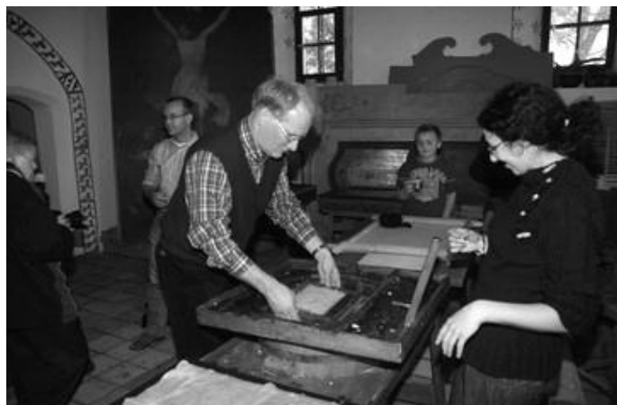
Bezoek aan drukkerijmuseum