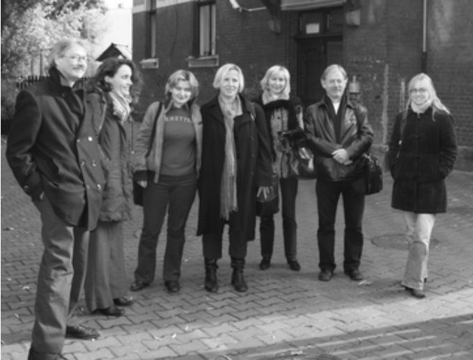
Voor Dom Dzieck "Mlody Las"

Cardea Jeugdzorg helpt kinderen, jongeren en hun ouders in Zuid Holland – Noord. Veel van onze cliënten komen uit Leiden. In Leiden hebben we allerlei afdelingen en projecten voor jongeren van 12-20 jaar: het daghulpcentrum voor oudere jeugd, allerlei vaardigheidstrainingen, crisisopvang, begeleid wonen en arbeidstoeleiding (Werkhotel) en dergelijke.