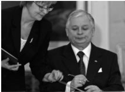
President Lech Kasczynski

Daarnaast maakte de uitslag ook een duidelijke regionale scheiding zichtbaar: Het Oosten (ooit Russisch) stemde in meerderheid Recht en Rechtvaardigheid, het Westen (voorheen nog Pruisisch) en het Zuiden (voorheen Oostenrijks) stemden Burgerforum.