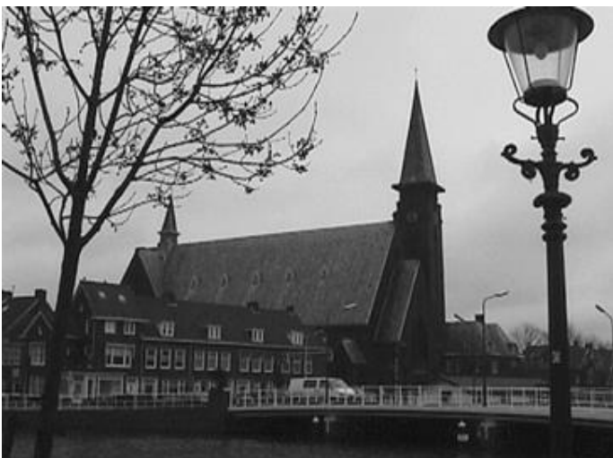
R.K. Kerk aan de Herensingel

Je hebt Leidse grachten, Leidse stegen, Leidse musea, monumenten en mensen, Leidse kaas, Leidse studenten en Leidse politici, maar ook: Leidse Polen. Hoeveel, waar en waarom? Dat is de vraag. Je ziet ze niet altijd staan. Maar je hoort ze soms wel, als je zelf een paar woorden Pools verstaat, in Leidse supermarkten, in het café, op het perron, bij de bushalte. En een paar keer per maand natuurlijk in de R.K. Kerk aan de Herensingel, waar diensten in het Pools worden gehouden voor de Polonia van Leiden en Omstreken.