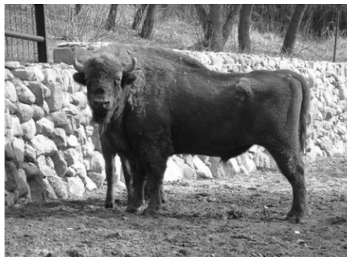
Wisent