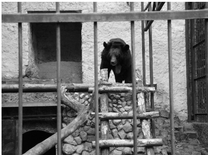
Himalaya-beer heeft een nieuw hok nodig.

indrukwekkende hoeveelheid educatieve programma's ontwikkeld, waar wij nog heel wat van kunnen leren. Wat onderzoek betreft, ondersteunen ze bijvoorbeeld onderzoek naar oude fruitrassen, en naar broedgedrag van de Grote zaagbek (bij ons een wintergast). Ook bezochten we een tentoonstelling met natuurfoto's in een