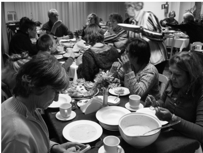
Lekkere soep ( zurek , voor beginners)

De stedenband Leiden Toruń bestaat dit jaar 19 jaar. De contacten die in 1988 zijn ontstaan tussen bewoners van beide steden, groeien nog steeds. Het lijkt zelfs wel of ze ieder jaar beter en gevarieerder worden. Nadat wij afgelopen mei een delegatie uit Toruń hadden mogen ontvangen, was het in de herfstvakantie de beurt aan geïnteresseerde Leidenaars om hun Poolse zusterstad te bezoeken.