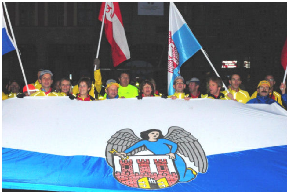
Huldiging van de estafettelopers voor het stadhuis in Toruń.