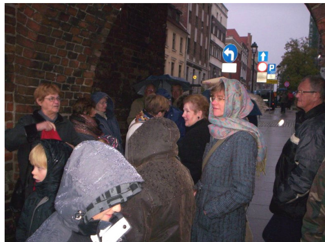
Schuilen voor de regen. Dat komt niet vaak voor tijdens een bezoek aan Toruń

Dat "Wij Gaan" betekende heel veel denkwerk en heel veel organiseren. Praten, telefoneren en informeren. Hoe lopen we, hoe zijn de wegen, wat kunnen we onderweg verwachten.