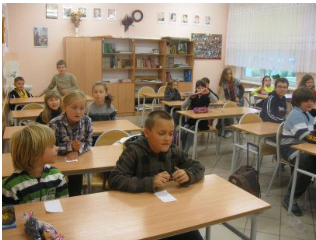
Vakantie en toch naar school