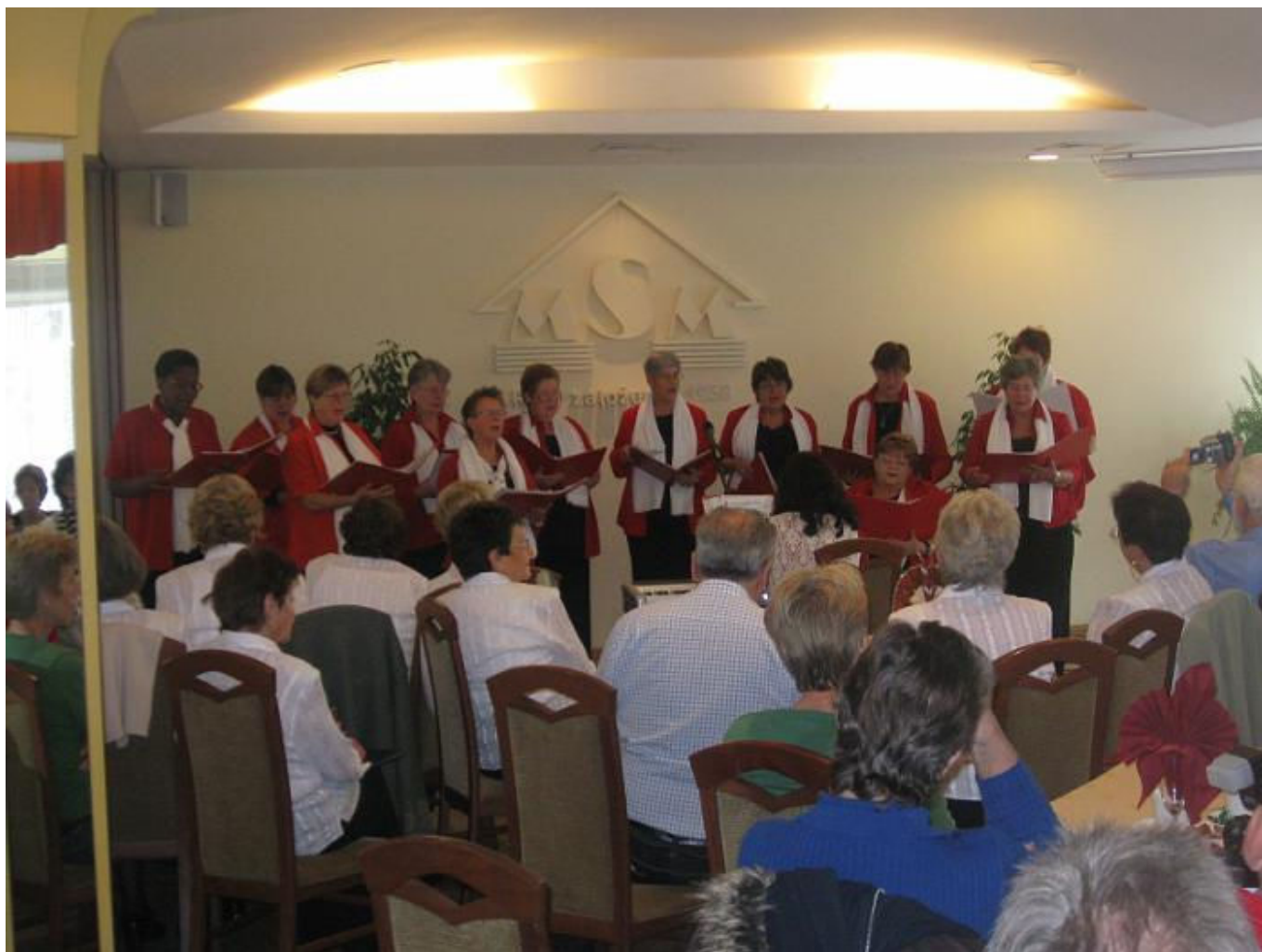
Het Leidse Tam Tam koor tijdens hun optreden in Toruń