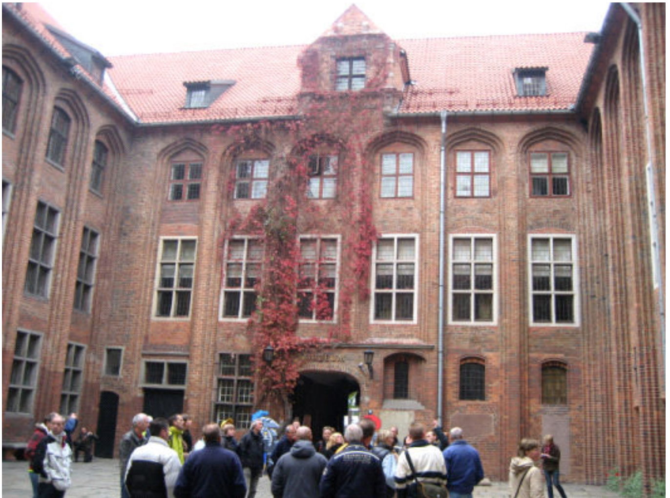
Binnenplaats stadhuis met bezoekers uit Leiden