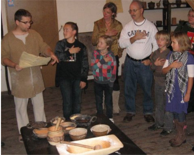
Peperkoeken bakken

Uiteraard mocht het bakken van de traditionele Toruńse koeken niet op het bezoeken menu ontbreken. Samen met Agata en Teun werden de peperkoeken gebakken. Vol overtuiging beloofde ons kwartet met de hand op het hart niets, maar dan ook niets van het recept te zullen prijsgeven. We konden aansluiten bij een Engels-Poolse uitwisselingsgroep die in het Engels werd begeleid door de hoofdkoekenbakker.