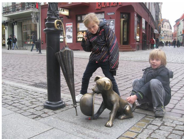
De twee jongste Toruń-bezoekers ontdekken de stad

Deze run naar Leiden beviel de hardlopers zo goed, dat een van de renners opmerkte: "volgend jaar lopen we naar Toruń". Deze opmerking, als grapje bedoeld, viel in vruchtbare aarde. Vanaf die tijd werd er serieus nagedacht over de mogelijkheid een estafette van Leiden naar de zusterstad Toruń te lopen. Met behulp van een draaiboek van de bekende Roparun werd bekeken of het lopen naar Toruń mogelijk was. Toen dat zo bleek te zijn, was een beslissing snel genomen: Wij Gaan!!!