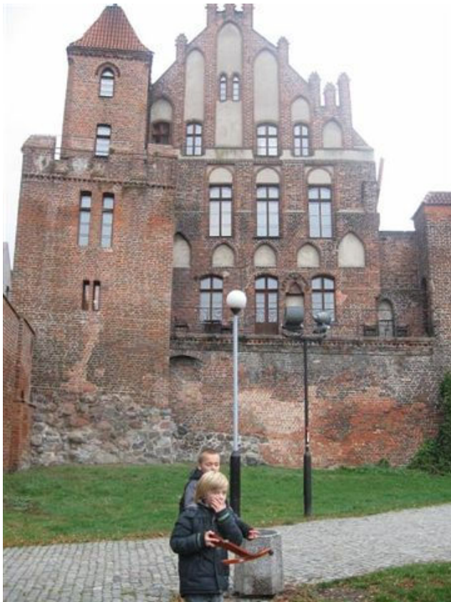
Het Podmurnagebouw in Toruń, waar de leden van de werkgroep vaak verblijven