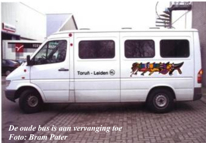
De oude bus is aan vervanging toe

En zo heb ik inmiddels zonder publiciteit al meer dan € 600,-. Echter: dat heb ik nog zo'n 33 keer nodig! Ik zie wel een probleem omdat in Leiden het Glazen Huis komt, dat ook veel geld weg zal snoepen. Toch ga ik er mijn best voor doen.