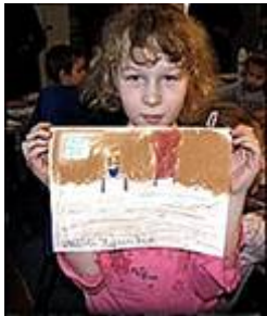
Jonge deelnemster van Fundacja Rozwoju i Aktywności Twórczej 'Les Artes'

Een van de uitgangspunten van de Stedenband is om mensen te koppelen aan mensen met dezelfde interesse in de zusterstad. In mijn geval werd er gezocht naar collega's in Toruń die ook met kunst en therapie, of met kunst en kinderen werken.