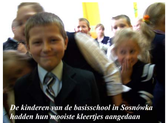
De kinderen van de basisschool in Sosnówka hadden hun mooiste kleertjes aangedaan

Daarna bezochten we een basisschooltje met 70 leerlingen die hun mooiste kleertjes aan hadden en die nieuwsgierig de invasie Leidenars bekeken.