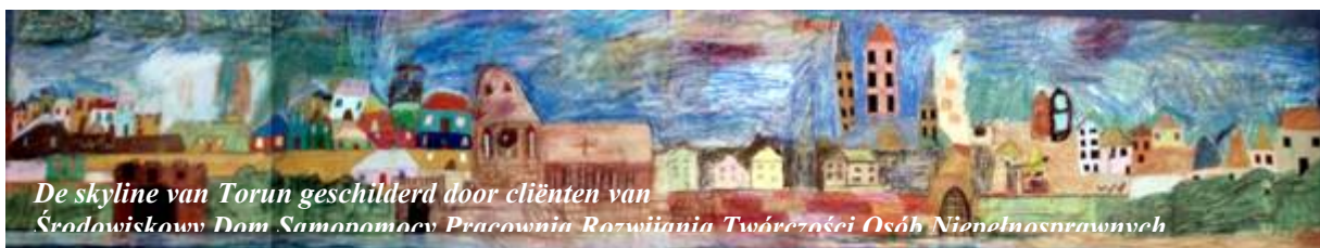
De skyline van Toruń geschilderd door cliënten van Środowiskowy Dom Samopomocy Pracownia Rozwijania Twórczości Osób Niepełnosprawnych