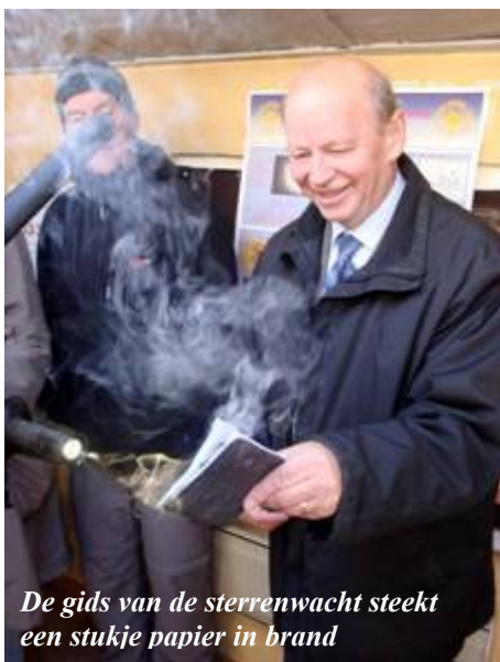
De gids van de sterrenwacht steekt een stukje papier in brand

De gids had een soort vergrootglas en een telescoop en daarmee stak hij een stuk papier in brand.