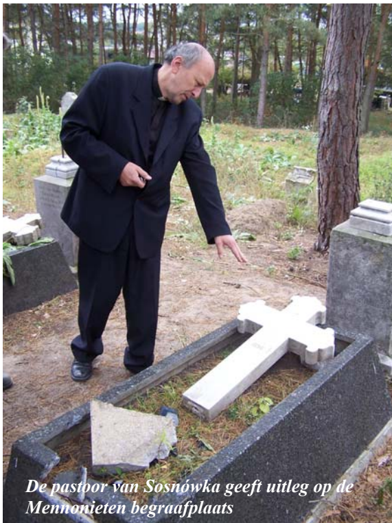
De pastoor van Sosnówka geeft uitleg op de Mennonieten begraafplaats

Via Facebook hadden we gezien dat dit heel erg nodig was. Daarom stond op 20 oktober een aantal Toruńgangers klaar bij het Podmurnagebouw, bereid om de handen uit de mouwen te steken en een aantal uren hard te werken om zo enkele graven op te knappen. Voorbereid als we waren, met stevige schoenen en laarzen aan, wilden we ons mannetje/vrouwje te staan, maar dat was niet nodig. Nadat we in een minibusje waren afgehaald werden we regelrecht naar de begraafplaats in Sosnówka gebracht. Daar waren de pastoor en het hoofd van de plaatselijke basisschool aanwezig om uitleg te geven over de geschiedenis en het leven van een groep Mennonieten in hun gemeenschap.