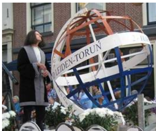
Copernicus tijdens de drie oktober optocht.

Tijdens de 3 oktober optocht nam de Stedenband Leiden - Toruń deel met een eigen praalwagen. Naast een grote wereldbol, die symbolisch om de zon draaide, zat ik als Copernicus verkleed op de praalwagen te turen in een sterrenkijker. Copernicus is bekend geworden vanwege zijn ontdekking dat de aarde om de zon draait en niet andersom. Dit tegen de zin van de toenmalige kerkelijke leer over de positie van de aarde in ons zonnestelsel.