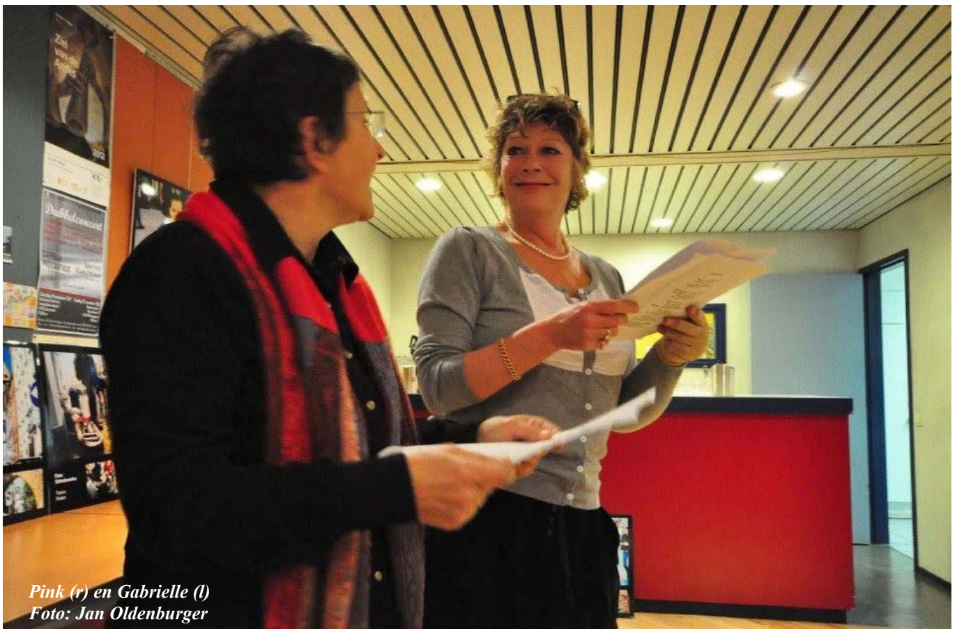
Pink (r) en Gabrielle (l)