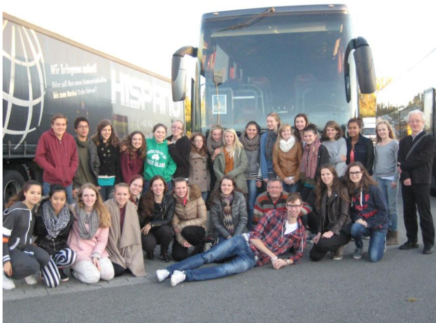
Jeugdkoor en dansgroep van BplusC

We hopen zeker nog een keer terug te gaan naar Toruń, misschien als groep maar ook zeker individueel. Want het is een prachtig land met heel lieve en hartelijke mensen en dat is zeker de moeite waard om nog eens naartoe terug te keren!