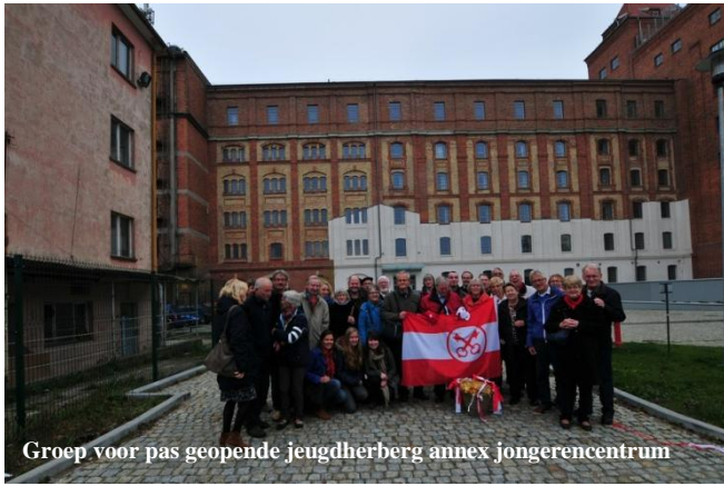
Groep voor pas geopende jeugdherberg annex jongerencentrum