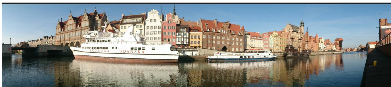
Uitstapje naar Gdańsk