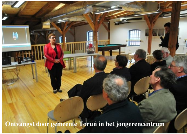
Ontvangst door gemeente Toruń in het jongerencentrum