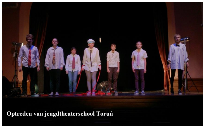
Optreden van jeugdtheaterschool Toruń