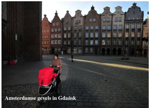
Amsterdamse gevels in Gdańsk