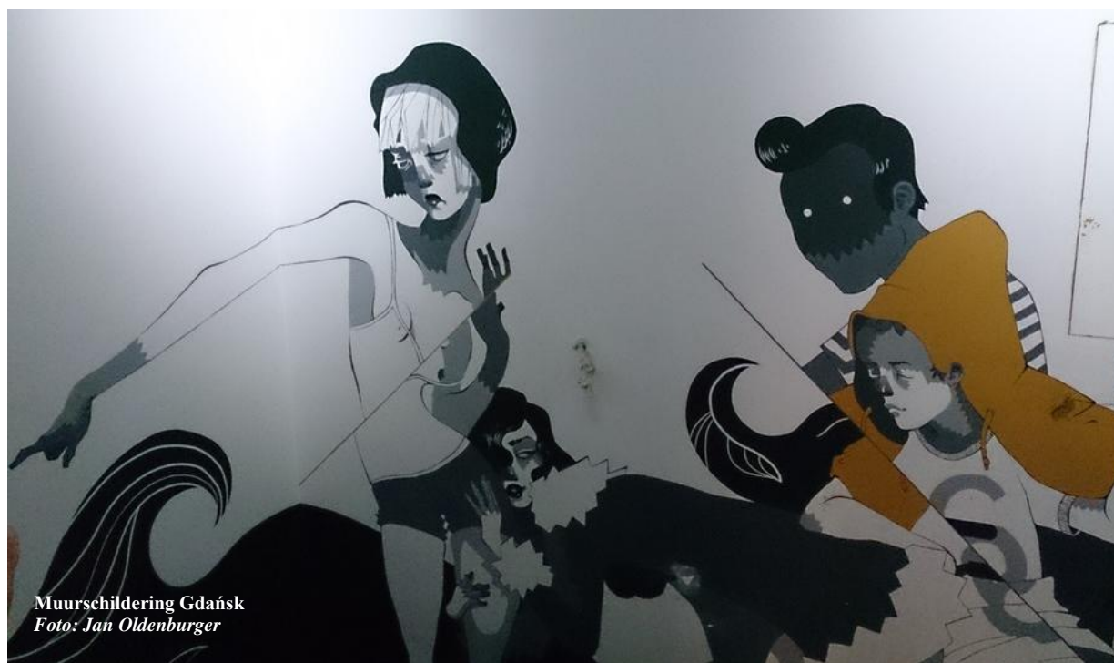
Muurschildering Gdańsk