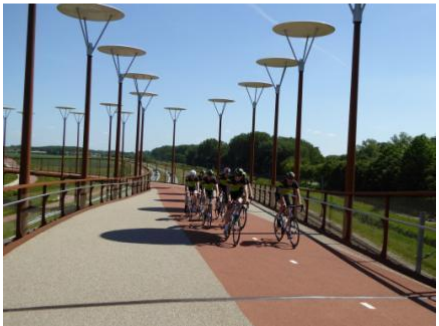
Jan Waaijer Fietsbrug in Zoetermeer