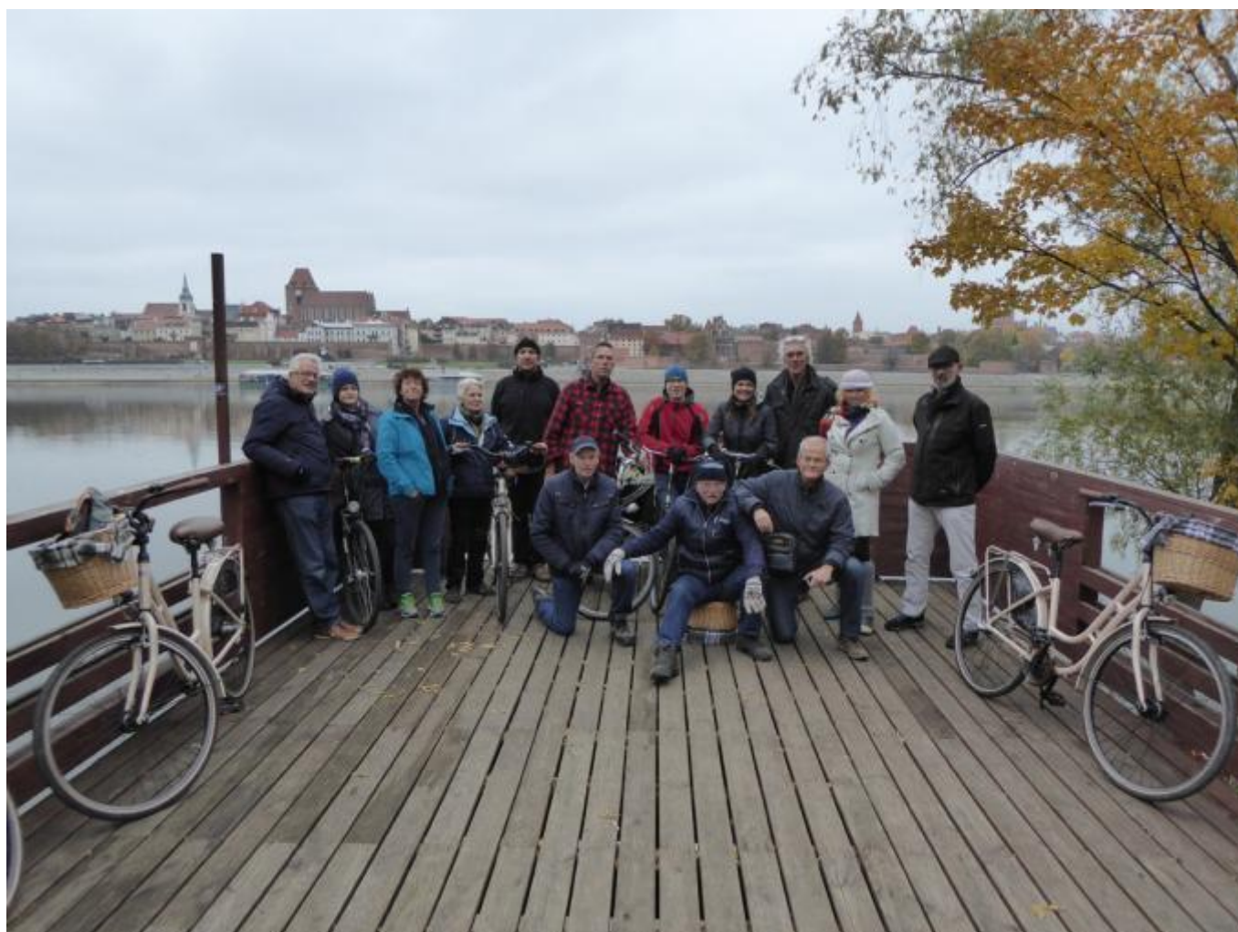
Fietstocht 25 oktober 2015, het Panoramapunt met zicht op de oude stad Toruń