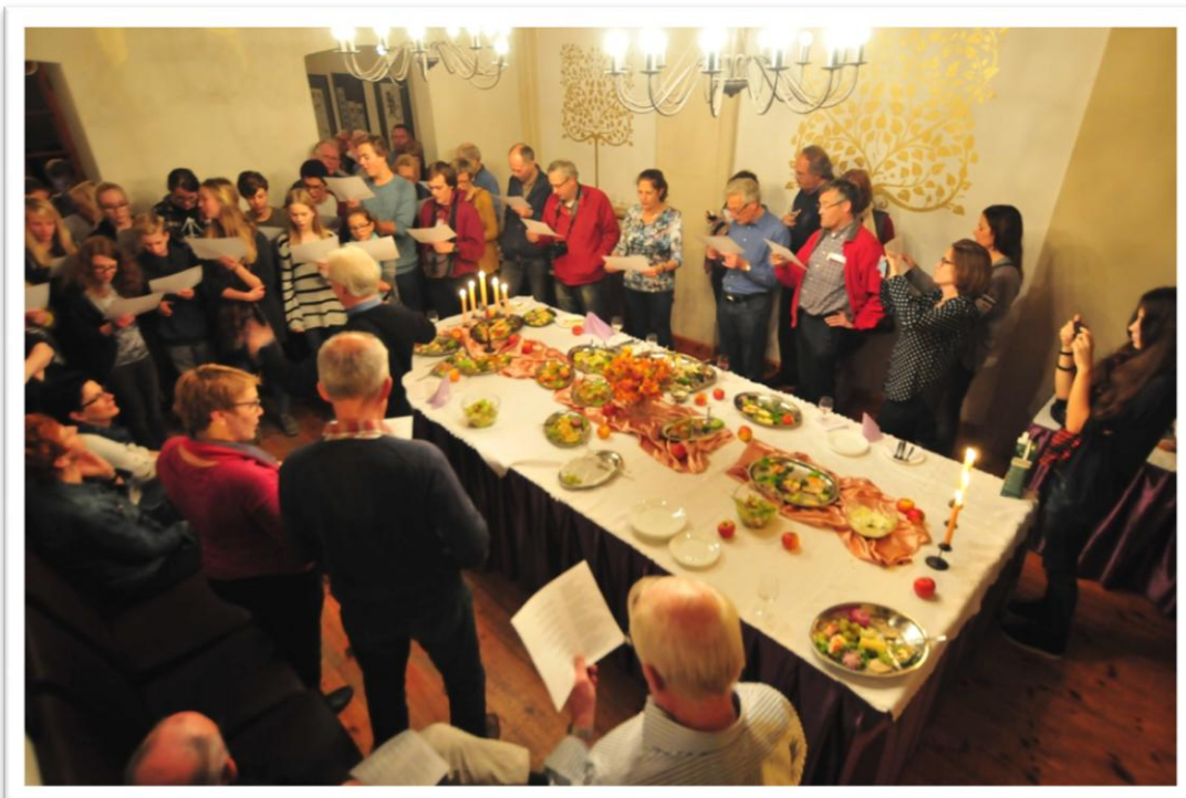
Zingen tijdens het afscheidsbuffet