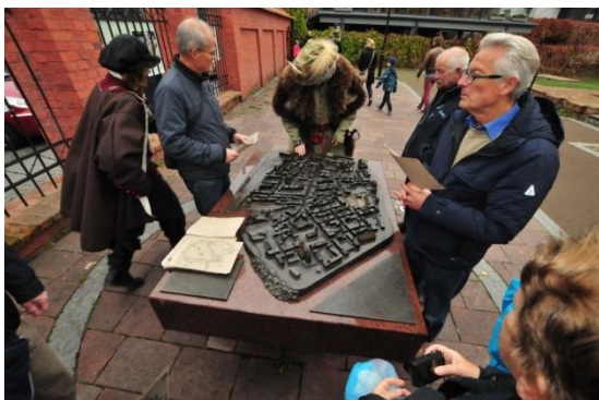
Maquette van de vesting