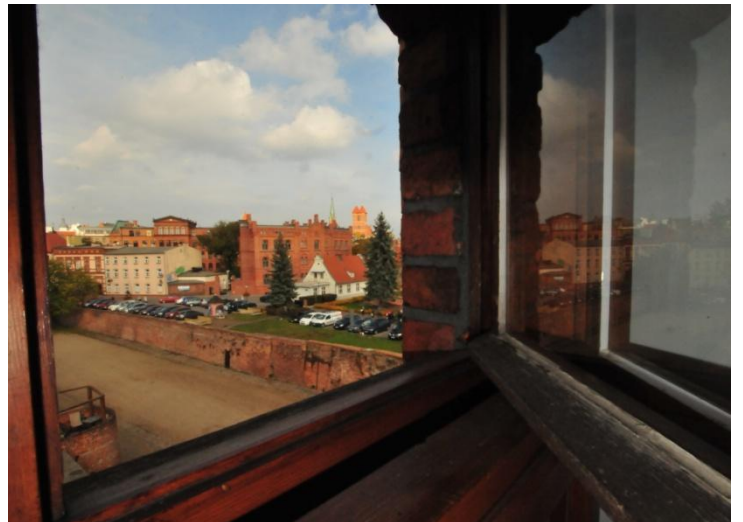
Uitzicht op Toruń