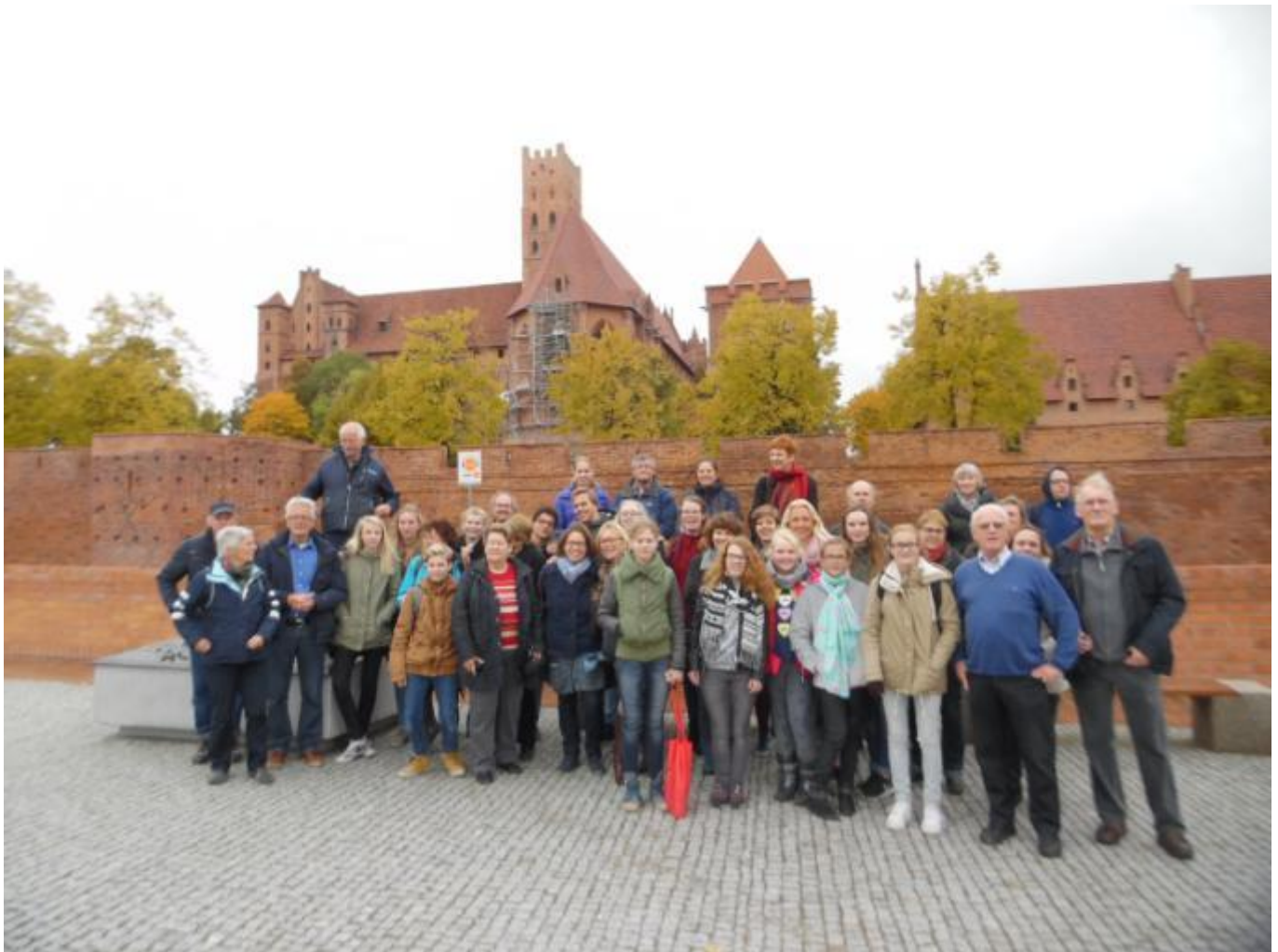
Bezoek aan kasteel Malbork in Gdańsk