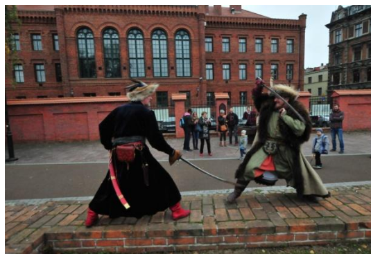
Gevecht tijdens historisch openluchtspel