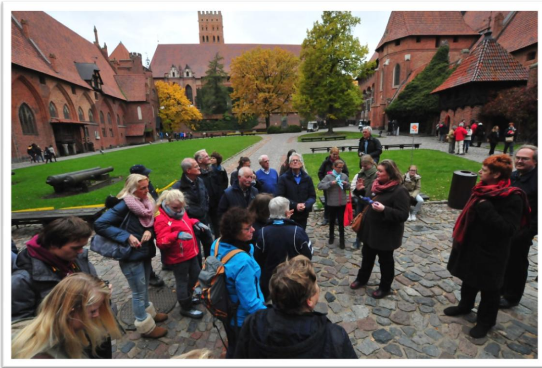
Bezoek aan kasteel Malbork