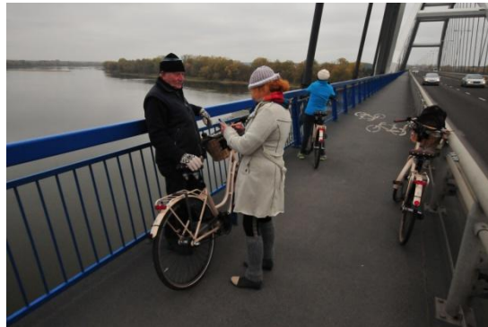
... ging ook over de nieuwe brug