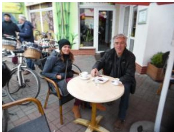
Fietstocht, en dan is er koffie ...

Gniezno, met 70.000 inwoners, is een voorbeeld van een middelgrote Poolse provinciestad, goed voor een eerste kennismaking met Polen. Hier bezochten we de allereerste Poolse kathedraal, de indrukwekkende Sint Adalbert kathedraal. Verder was er in de winkelstraat één banketbakker (Cukierna) met koffie en een enorme sortering gebak, die op zijn vier stoeltjes aan twee tafeltjes successievelijk bijna alle Leidenaren mocht begroeten.