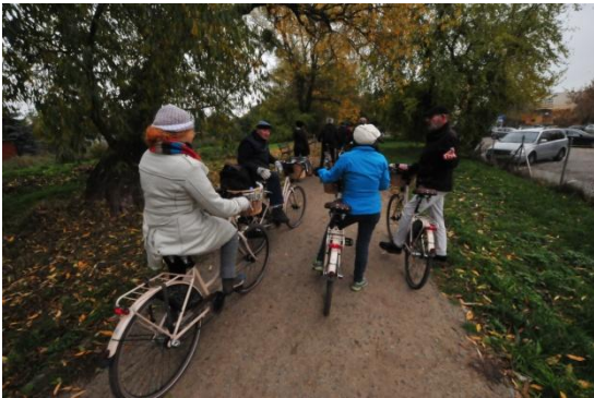
De fietstocht ...