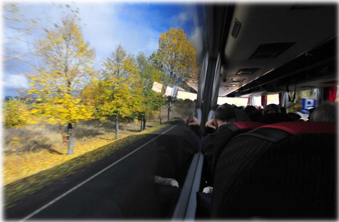
In de bus ...