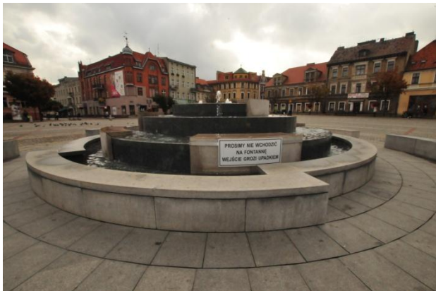
Centrum van Gniezno