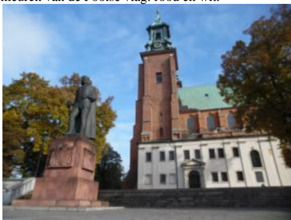
Sint Adalbert kathedraal

Twee uur rijden verder kwamen we aan in Gniezno, de allereerste hoofdstad van Polen (vanaf ± 1000 na Chr.). Gniezno (de naam betekent 'nest') werd volgens de legende gesticht door de Poolse oervader Lech. Die zag op deze plek hoe een witte adelaar zijn nest verdedigde, tegen de achtergrond van een bloedrode ondergaande zon. Vandaar de witte adelaar in het Poolse wapen en de kleuren van de Poolse vlag: rood en wit.