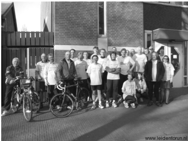
Groepsfoto deelnemers