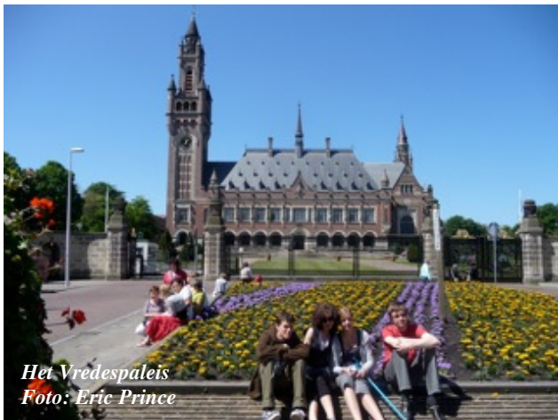
Het Vredespaleis