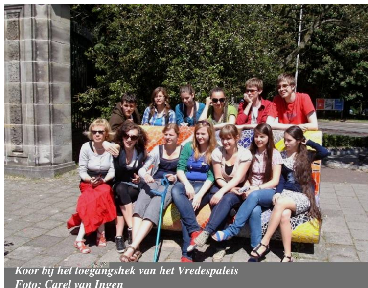
Koor bij het toegangshek van het Vredespaleis