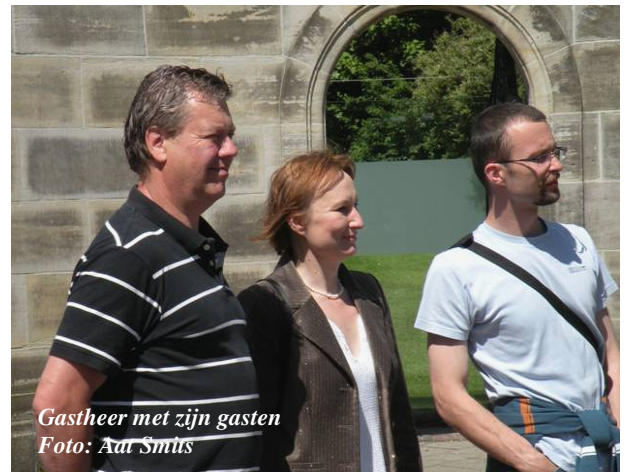
Gastheer met zijn gasten