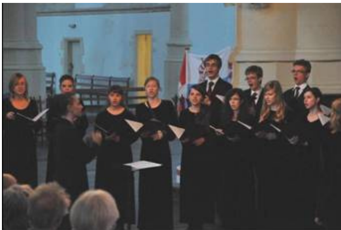
Toruń Music School Youth Choir