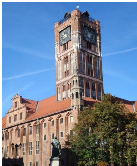
Het Stadhuis in Toruń:

Website: www.leiden-torun.eu E-mail: info@leiden-torun.eu Facebook: Twincityorganisation Leiden-Torun Twitter: @LeidenTorun Giro: NL66 INGB 0004 8780 29 t.n.v. STG Stedenband Leiden-Toruń Leiden, mei 2023