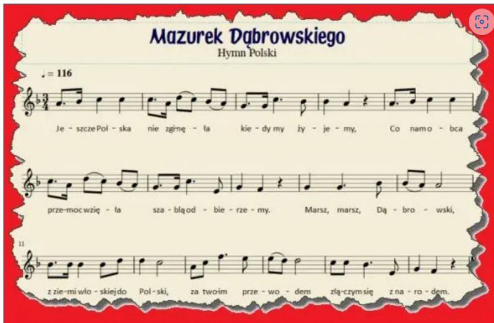
Volkslied van Polen